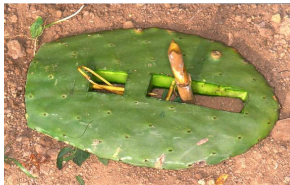
Fig. 2 - Tradizionale metodo di cattura nell'Arcipelago Pontino realizzato con una pala di fico d'india.

In Sardegna è diffusa una forma di cattura illecita ai tordi praticata principalmente tra novembre e febbraio nel Sulcis meridionale e nel Sarrabus. Qui i mezzi di cattura tradizionali sono rappresentati da crini di cavallo disposti sopra un rametto tra la vegetazione in modo da formare un cappio per gli uccelli che si posano (fig. 3). Oggi molto spesso al posto dei crini vengono impiegati fili di nylon e sono inoltre utilizzate reti e trappole. Altra tecnica impiegata è rappresentata da un laccetto ancorato a terra per mezzo di filo di ferro, su cui viene infissa una bacca come esca. I tordi vengono uccisi per finalità commerciali: vengono venduti a privati e ristoratori locali per la preparazione di un piatto tipico, le "grive" (i tordi in sardo) al mirto. Anche in questo caso, dal momento che i mezzi di cattura non sono selettivi, oltre ai tordi vengono uccisi uccelli appartenenti a molte altre specie: tra le vittime più frequenti, pettirossi, occhiocotti, pernici sarde, fringuelli e frosoni.