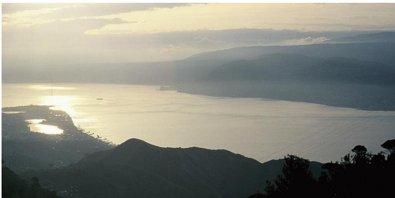
Fig. 6 - Veduta dello Stretto di Messina, ripreso dalla sponda siciliana. Attraverso lo stretto si stima che ogni anno transitino alcune decine di migliaia di uccelli da preda.

Un altro esempio di prelievo illegale che affonda le radici nel passato riguarda l'uccisione dei rapaci in migrazione. La realtà più conosciuta è quella relativa alla cosiddetta "caccia all'adorno", praticata in corrispondenza delle due sponde dello Stretto di Messina (Fig. 6). I rapaci vengono abbattuti con armi da fuoco quando transitano sullo stretto nel corso delle migrazioni. Un tempo il maggior numero di individui veniva ucciso in primavera, per via delle diverse modalità con cui avviene la migrazione di ritorno; attualmente il prelievo illegale è più intenso in autunno a seguito dell'attività di repressione condotta dal Corpo Forestale dello Stato, ora CUTFAAC, nei mesi primaverili. La specie più colpita è il falco pecchiaiolo (localmente chiamato "adorno"), tuttavia vengono abbattuti tutti gli uccelli veleggiatori in transito (come aquile e cicogne), anche appartenenti a specie rare o molto rare. L'uccisione dell'adorno pare sia legata a una credenza locale secondo la quale l'uomo che abbatte almeno un falco pecchiaiolo si assicura la fedeltà della propria sposa per l'anno successivo.