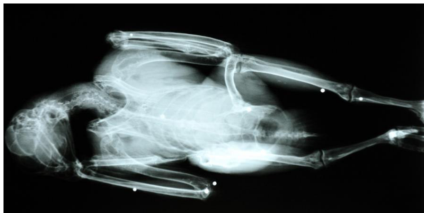
Fig. 4 - Radiografia di una femmina adulta di Lanario rinvenuta il 22 gennaio 2009 nel comune di Castenaso (BO). Nell'immagine sono riconoscibili nove pallini di diverso diametro.

L'incidenza del fenomeno è sottostimata, in quanto non tutti gli uccelli colpiti vengono recuperati; inoltre una parte dei rapaci feriti in modo non grave mantiene la possibilità di volo e non viene quindi rinvenuta e recuperata. Un ulteriore fattore che concorre a sottostimare la frequenza di questi atti illeciti risiede nel fatto che l'accertamento del ferimento con armi da fuoco spesso può avvenire solo tramite radiografia (Fig. 4); sfortunatamente molti centri di recupero non dispongono dei mezzi per poter effettuare questo test diagnostico su tutti i soggetti ricoverati.