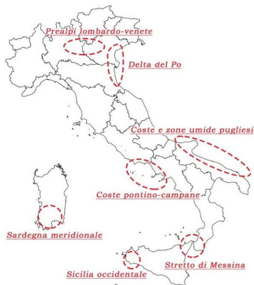
Fig. 7 - I black-spot dove le attività illecite nei confronti degli uccelli sono più intense.

I risultati delle indagini effettuate nel corso degli anni hanno permesso di mettere in luce come i reati contro gli uccelli selvatici non avvengano con la stessa frequenza sull'intero territorio nazionale. In alcune aree il fenomeno risulta particolarmente intenso; queste aree vengono definite black-spot secondo una terminologia riconosciuta a livello internazionale. In Italia è possibile individuare almeno sette black-spot : le Prealpi lombardo-venete, il Delta del Po, le coste pontino-campane, le coste e zone umide pugliesi, la Sardegna meridionale, la Sicilia occidentale e lo Stretto di Messina (Fig. 7). A queste zone “calde” se ne aggiungono altre dove il prelievo illegale di uccelli selvatici, pur non essendo intenso come nei black-spot , appare comunque più frequente che nelle restanti parti del territorio. Tra queste ne compaiono alcune contraddistinte da elevate densità di cacciatori (come la Liguria, la fascia costiera della Toscana, la Romagna, le Marche) o caratterizzate dalla presenza di pratiche venatorie tradizionali oggi non più consentite dalla normativa vigente (come il Friuli-Venezia Giulia e parte del Veneto, dove un tempo era diffusa l'uccellazione).