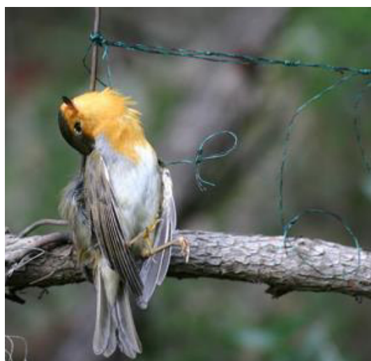
Fig. 3 - Lacci utilizzati in Sardegna per la cattura illecita dei tordi.