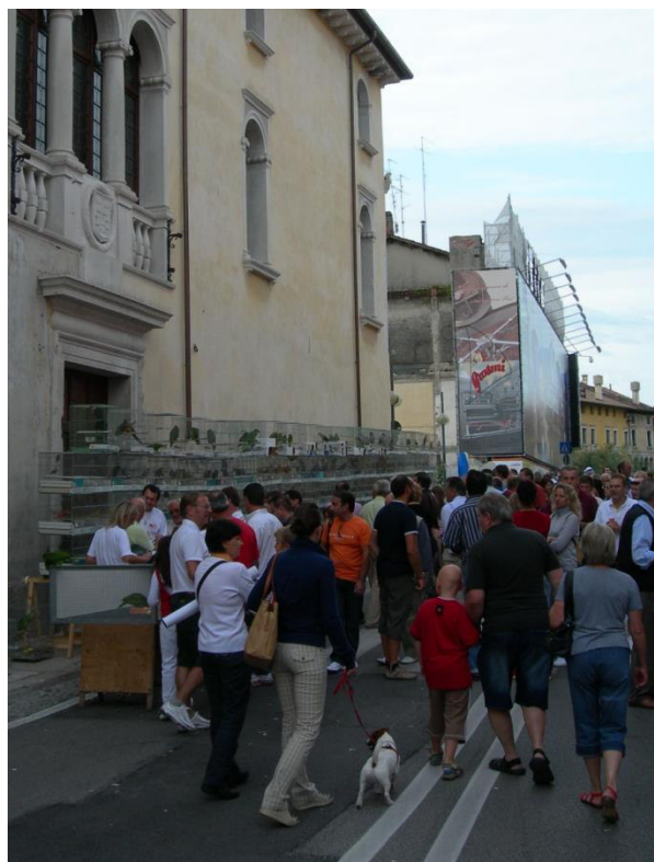
Fig. 5 - La Sagra Dei Osei di Sacile. A destra: tordo sassello durante la gara del canto. A sinistra: la fiera mercato degli uccelli.

Partecipando a manifestazioni come la Sagra di Sacile ci si rende conto di come ancora oggi in alcune realtà locali sia forte il legame con le attività di aucupio un tempo praticate diffusamente in molte regioni del centro-nord. Alla cattura di piccoli uccelli migratori sono collegate tradizioni culturali e gastronomiche che ancora ai nostri giorni alimentano forme di prelievo e di commercio illegali di uccelli selvatici destinati alla detenzione in cattività o alla preparazione di piatti della tradizione locale, come la cosiddetta “polenta e osei” 11 .