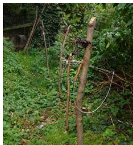
Fig. 1 - Catture illegali nelle Prealpi lombarde. A sinistra, Pettirosso ucciso da una trappola "sep". A destra, fila di archetti posizionati per la cattura.